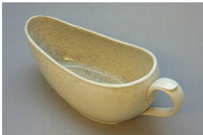
Le pot de chambre

L'usage d'un urinal devint indispensable ; dissimulé sous les amples jupes des dévotes, il se devait d'être adapté à la morphologie féminine. La forme d'une saucière fut donc adoptée pour cet objet particulier.