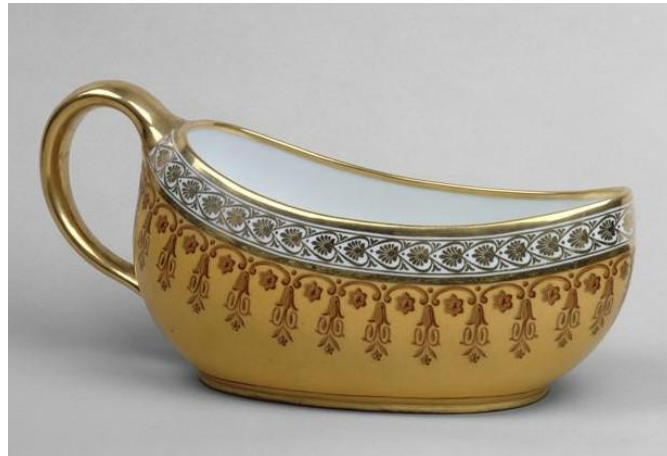
Exemplaire en porcelaine

Ces objets particuliers ne laissèrent pas les collectionneurs indifférents, d'autant que si la plupart étaient en céramique, certains étaient en argent, comme celui d'une maîtresse d'Henry IV.