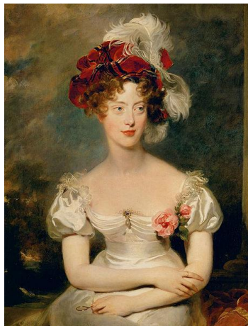
La duchesse de Berry

En 1832, la duchesse de Berry tente de conquérir le trône de France pour son fils. Dans ce but, elle se rend clandestinement dans des fermes, en passant la nuit chez les paysans, avec l'espoir de soulever la Vendée.