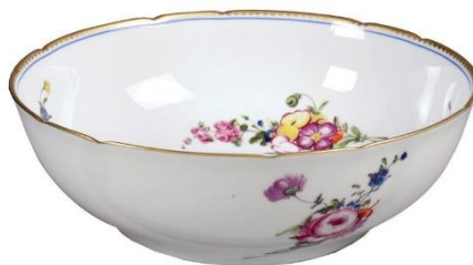
Saladier fleuri à double usage

Chaque soir, elle réclamait un vase de nuit et recevait un rutilant saladier en faïence fleurie. Le voisinage, averti par le « téléphone vendéen », veilla à ce qu'à chaque halte, la duchesse trouve à sa disposition l'indispensable récipient que l'on appela « le saladier de la duchesse ».