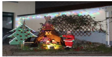
La plus originale