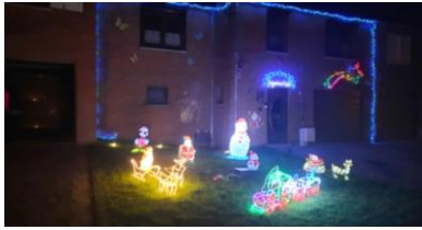
La plus belle