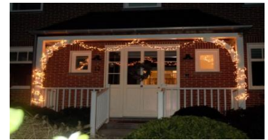
La plus méritante