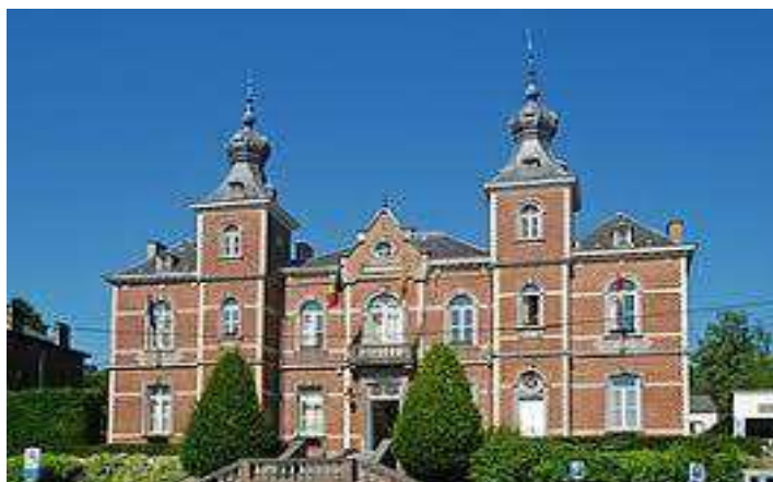
Hôtel de Ville d'Ottignies-Louvain-la-Neuve.

Une copie électronique du courrier de l'AHPR est disponible sur simple demande à adresser au secrétariat.