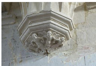
Cul de Lampe