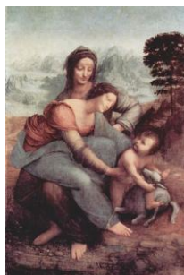
Sainte-Anne, la Vierge Marie et l'Enfant Jésus par Léonardo da Vinci.

À proximité du début de l'avenue de la Résistance, le clos Sainte-Anne est perpendiculaire à la rue du Petit-Ry ; le sentier Sainte-Anne relie la rue du Petit-Ry à la rue du Champ Sainte-Anne près de la clinique Saint-Pierre.