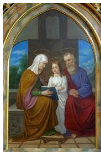
Sainte-Anne enseignant la lecture à Marie en présence de Saint-Joachim.

Le 26 juillet est la fête de la sainte, mère de la Vierge Marie, dans le calendrier romain général de 1960, réformé en 1969 par Paul VI, elle et devient celle de Sainte-Anne et de Saint-Joachim.