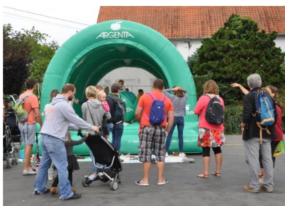
La joie des enfants...