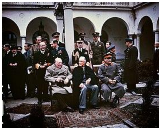
Churchill, Roosevelt et Staline à Yalta