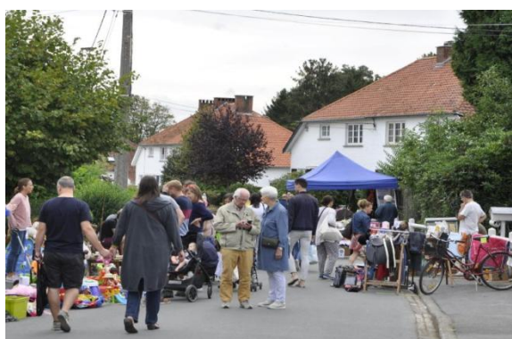
Se promener, flâner ...