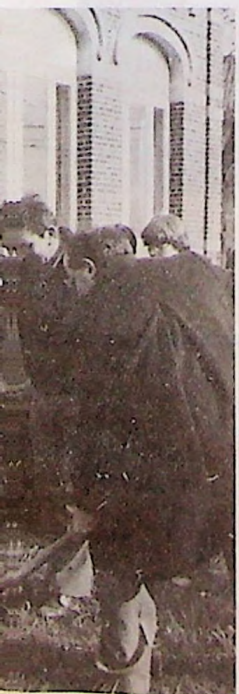
Sous l'œil attentif de Mme Mambourg et des enfants de l'école de Limauges, le Bourgmestre et l'Echevin des Fêtes procèdent à la plantation du tilleul commémoratif.