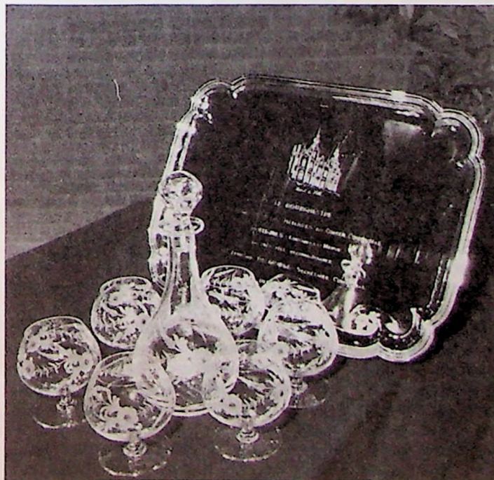
La carafe et les verres (offerts par le personnel communal) garniront le plateau gravé à l'effigie de la Maison Communale.