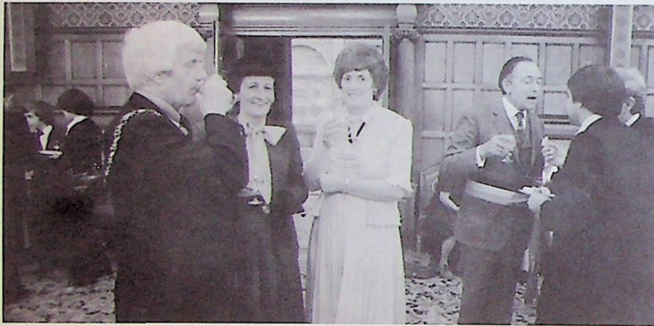
Avec le Lord Maire et la Lady Mayoress de Sheffield

Que de chemin parcouru à la Philharmonie royale Concordia depuis ce jour mémorable d'avril où une formation réduite vint donner l'aubade à S.M. la Reine Fabiola, en visite privée à Ottignies. C'était au printemps de 1978. Quelques mois plus tard, la Philharmonie partait à Arosa aux Jeux sans Frontières.