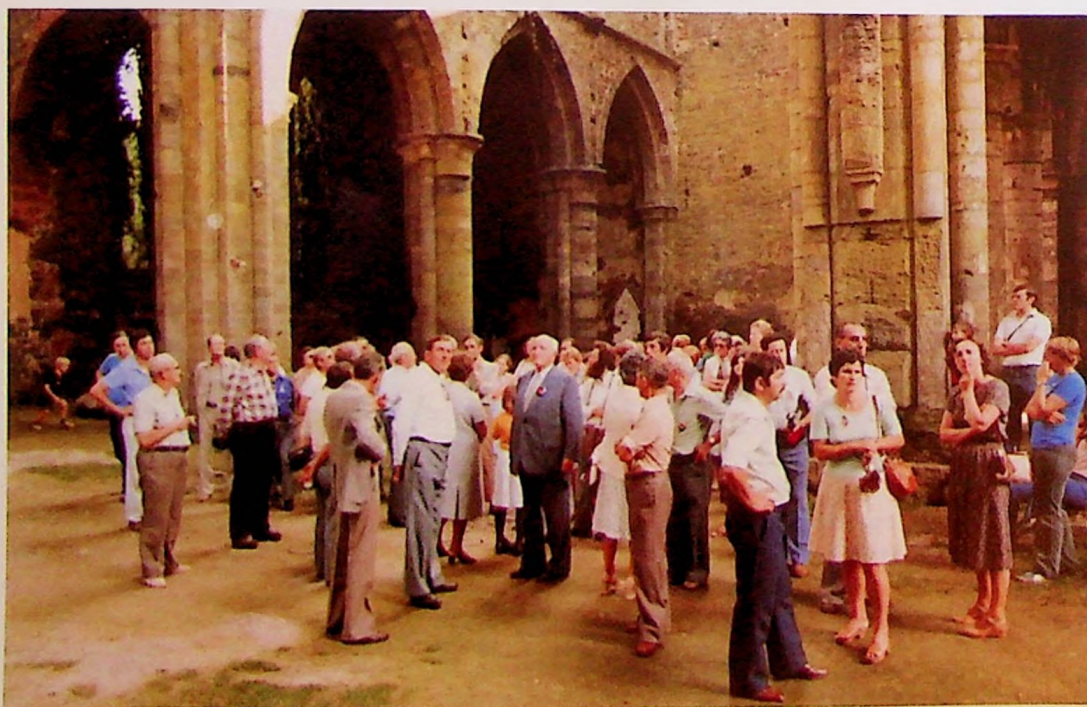
La délégation jassanaise visite un des hauts-lieux du Roman País : les ruines de l'ancienne abbaye cistercienne de Villers-la-Ville

Le lendemain matin, les invités se joignirent aux autorités d'Ottignies-Louvain-la-Neuve et aux représentants de la Province pour l'inauguration officielle du Domaine provincial du Bois des Rêves et de sa piste de santé