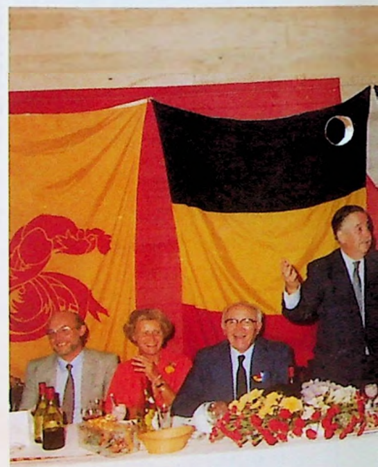
"Quelle atmosphère" s'exclame l'Am... rappelant l'apostrophe d'Arletti