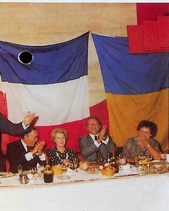
l'ambassadeur de France, Monsieur Vauris, et Louis Jouvet dans un film célèbre

Les municipales de la petite ville du département de l'Ain et celles d'Ottignies-Louvain-la-Neuve ont eu lieu dernièrement au Centre Culturel d'Ottignies. Ce fut incontestablement le point d'orgue d'un programme riche en moments.