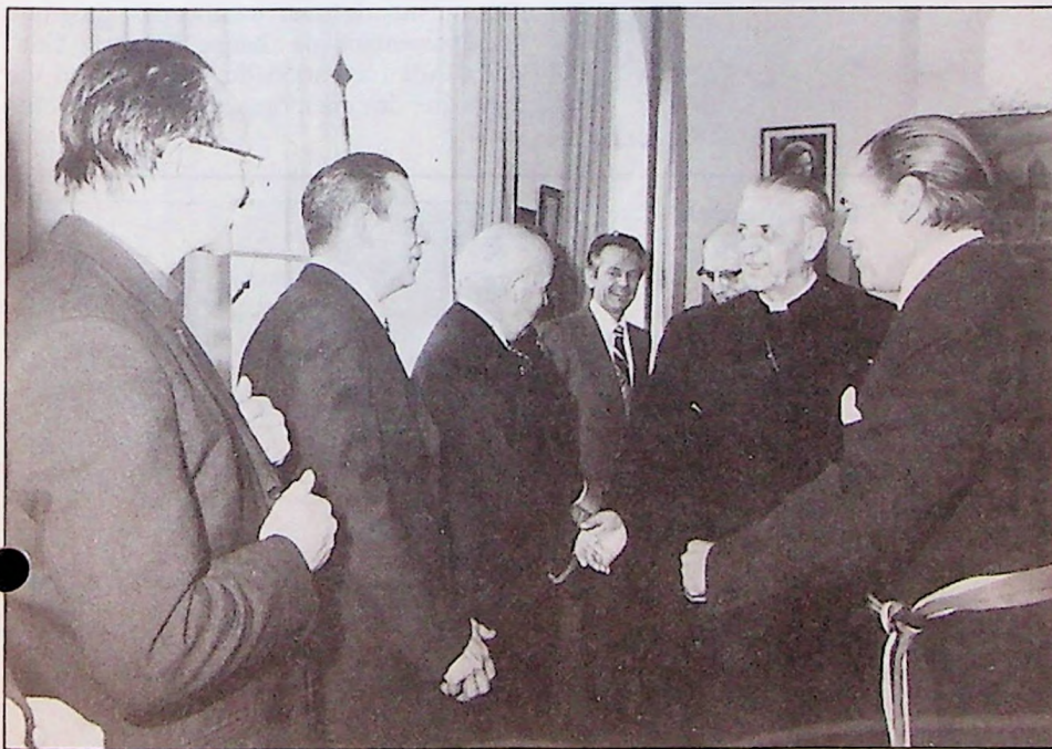
LES ADIEUX DU CARDINAL SUENENS

l'ont voit ici passant l'inspection des Gardes Ruraux massés devant la Maison Communale d'Ottignies-Louvain-la-Neuve.