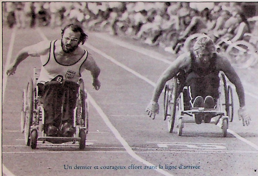
Un dernier et courageux effort avant la ligne d'arrivée