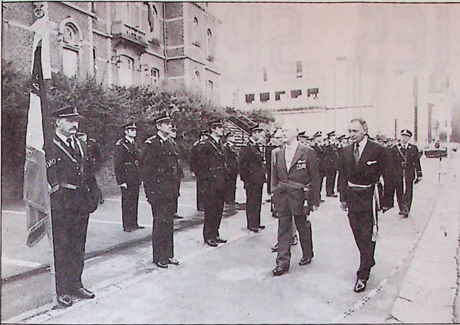
Dimanche 9 septembre 1979, la Fraternelle des Policiers Ruraux, créée en 1949, a célébré son 30 e anniversaire en présence de M. Cluyse, Commissaire d'Arrondissement, que

l'ont voit ici passant l'inspection des Gardes Ruraux massés devant la Maison Communale d'Ottignies-Louvain-la-Neuve.