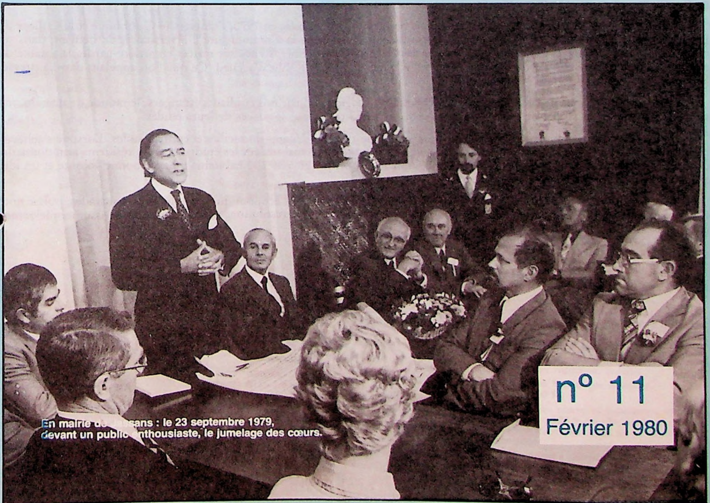
En mai 1979, le maire de Louvain-la-Neuve, le 23 septembre 1979, devant un public enthousiaste, le jumelage des cœurs.