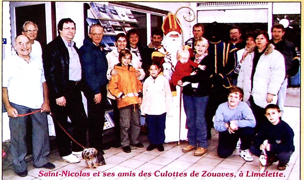
Saint-Nicolas et ses amis des Culottes de Zouaves, à Limelette.