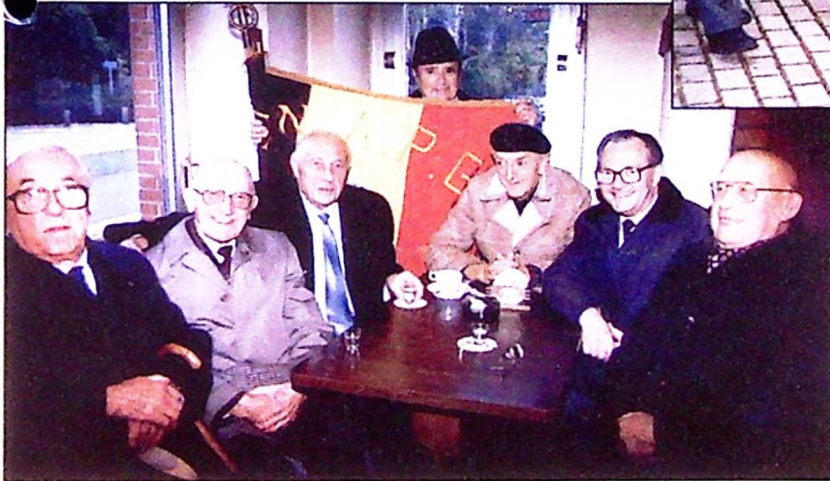
Un petit remontant avant le départ, le 11 novembre.