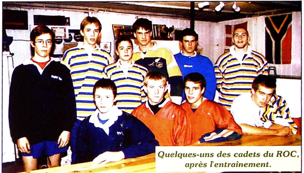
Quelques-uns des cadets du ROC, après l'entraînement.

"N'importe qui peut y jouer: un petit gros, un grand mince... Il faut en vouloir, et posséder un esprit d'équipe. Au Rugby, il n'y a pas de vedette. L'essence même de ce sport, c'est le partage. Sans les autres,