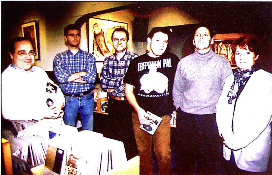
L'équipe de la Médiathèque.

"Musique classique". "En matière de musique, nous touchons tous les domaines, de manière à satisfaire le grand public et les spécialistes. Nous louons surtout le rock et la chanson française... un peu moins la musique classique, les musiques du monde, le rap et le jazz. Nos cours de langues en divers supports ont aussi pas mal de succès."