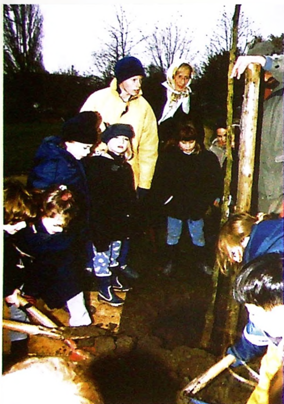
Activité jardinage pour ces élèves du Collège du Biéreau.