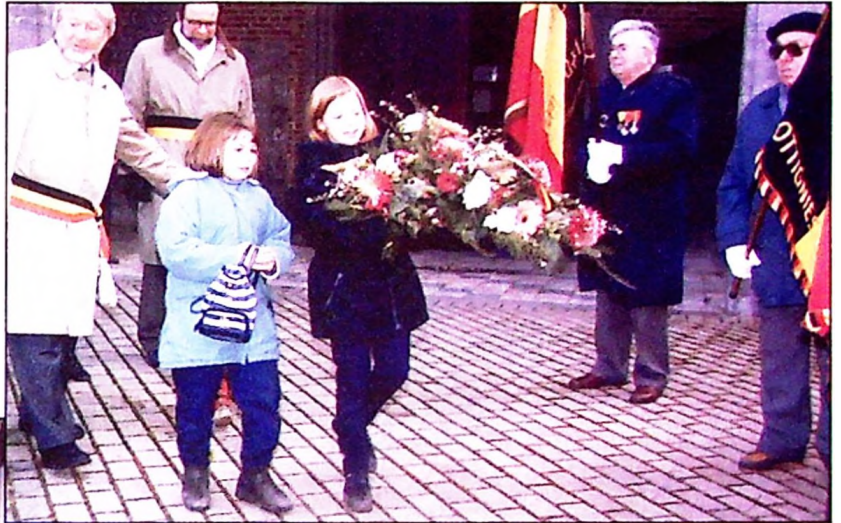
Des enfants de l'école communale de Limal ont fleuri le monument de Mousty.

Mois de novembre chargé, pour les anciens combattants. Le 6, ils ont déposé des gerbes de fleurs devant les pelouses d'honneur des cimetières de Cérroux, Mousty, Ottignies et Limelette. Le 11, comme de coutume, ils ont fêté l'anniversaire de l'armistice de 1918 en accueillant le flambeau sacré à la limite de Court-Saint-Etienne et en l'acheminant à travers la ville vers Limal. Et le 14, jour de la fête de la dynastie, un Te Deum était chanté en l'église Saint-Remi.