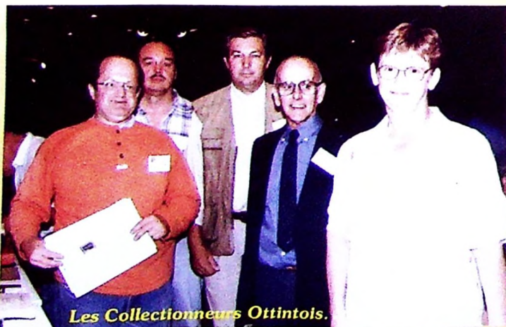
Les Collectionneurs Ottintois.

La 3 e bourse toutes collections organisée par le Cercle des Collectionneurs Ottintois, le 5 septembre, a attiré de nombreux philatélistes, cartophiles, numismates, "télécartistes"... Une vingtaine d'exposants - certains venus de la région flamande - présentaient leurs trésors sur 104 mètres de tables.