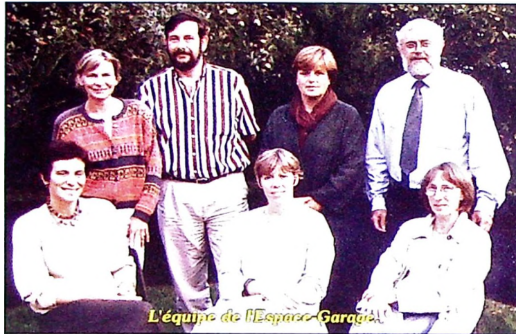
L'équipe de l'Espace-Garage