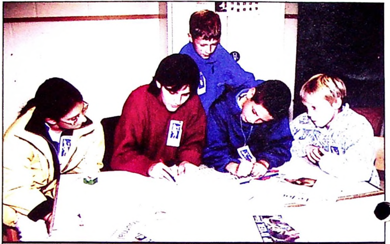
Les jeunes journalistes au travail.

Plusieurs participants ont goûté au métier de journaliste, en suivant une équipe de la télévision communautaire TV Com et quatre professionnels de la presse écrite. Ils ont appris les techniques de l'interview, l'importance des légendes des photos... Nous vous invitons à apprécier le résultat de leur travail.