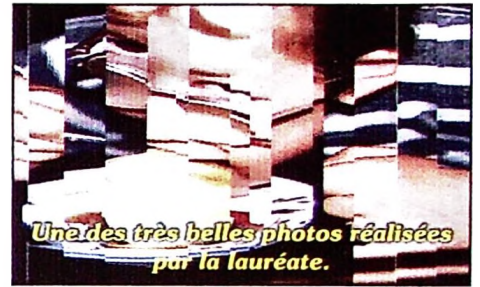
Une des très belles photos réalisées par la lauréate.

Les visiteurs ont également pu admirer les oeuvres réalisées dans le cadre du concours de dessin par les élèves des classes de M. Gérard et Mmes Delwiche, Bidoul, Pecheny et Delange (école de Blocry)... ainsi que