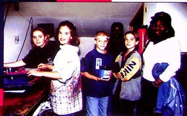
Près de 300 jeunes ont participé à la journée Place aux Enfants.