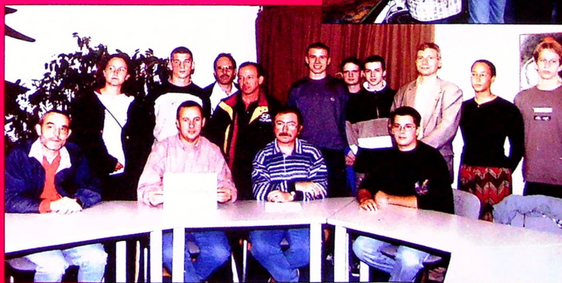
Notre équipe s'est classée 3 e au Trophée commune sportive.