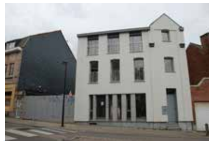
Le CPAS a acquis et rénové une ancienne maison de la chaussée de La Croix, pour y aménager notamment un logement de transit collectif.

Déjà expérimenté par des communes voisines, ce concept de logement de transit comportant une dimension collective est une première pour notre CPAS. Le projet du CPAS est de mettre ce logement à disposition de jeunes étudiants isolés, en rupture familiale, en difficultés sociales et financières dans le cadre de leur mise en autonomie, et de leur fournir un accompagnement soutenu tout au long de leur hébergement. L'accompagnement portera sur l'apprentissage de la gestion d'un logement «en bon père de famille» (paiement du loyer, respect des droits et devoirs d'un locataire et du règlement d'ordre intérieur, entretien...), l'apprentissage de la gestion d'un budget, le projet d'insertion socio-