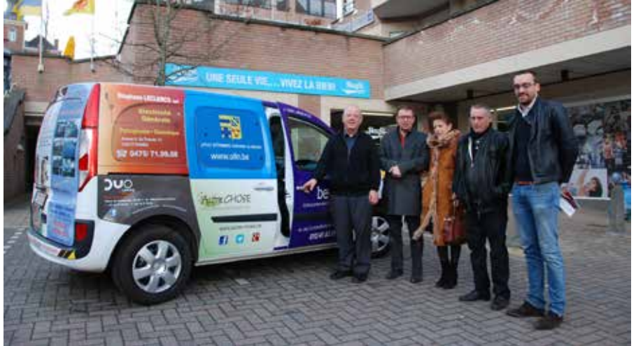
Représentants du CPAS et annonceurs: tout le monde est gagnant.

Il s'agit de la 2 e collaboration avec la société Visiocom, qui met gratuitement des véhicules à disposition des collectivités et communes, et se charge de recruter les annonceurs qui en financent l'achat. Chez nous, ils sont treize commerçants à avoir été séduits par le concept, dont