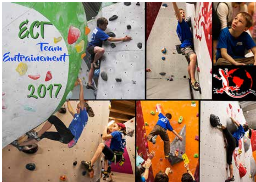
Physique, technique et mental.

Outre son équipe d'entraînement, le club compte quelque 440 abonnés, qui fréquentent la salle en autonomie, et 550 élèves (de 5 à plus de 80 ans) qui