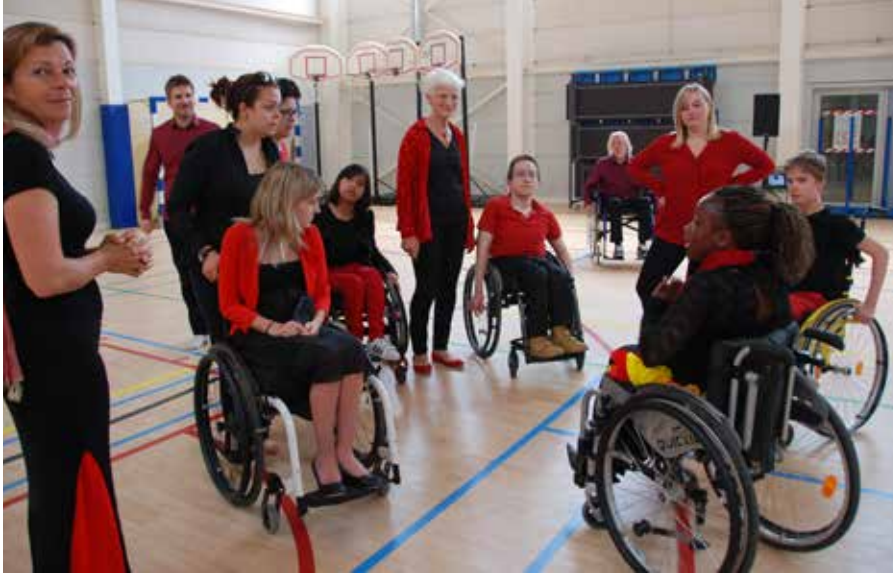
Le club de cyclo danse « Cycloceza » reprendra ses entraînements en octobre, à Lauzelle.

La journée « Printemps du sport », le 20 mai à Mousty, vous a permis de découvrir les disciplines à pratiquer dans notre ville.