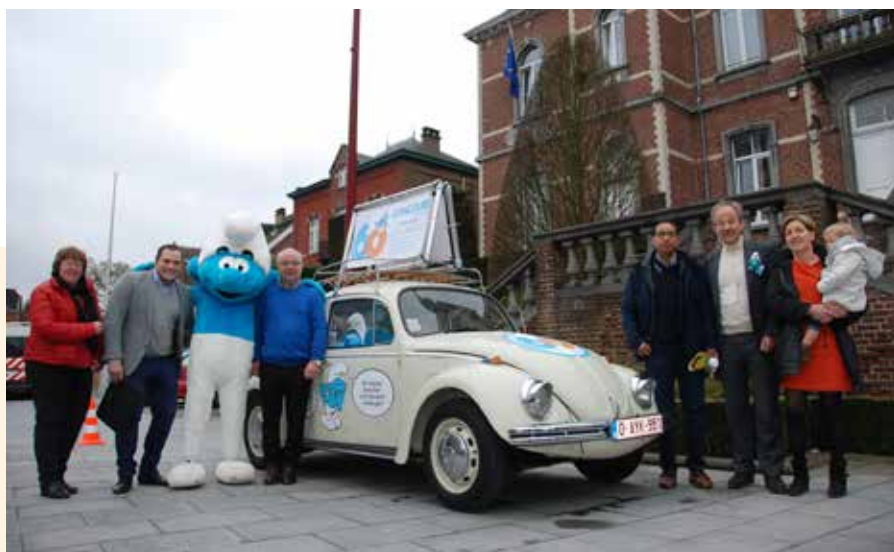
Tous ensemble avec les Schtroumpfs, au profit des enfants en détresse psychique et/ou sociale soignés à la clinique Saint-Pierre d'Ottignies.

La remise des prix du concours «Coccinelle» aura lieu lors des Fêtes de Wallonie, en septembre à Ottignies.