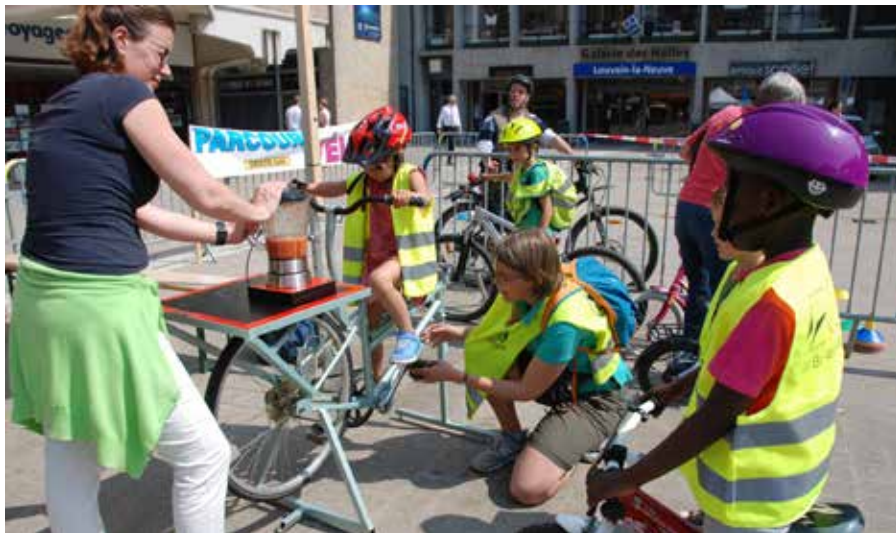
Pédaler avec Univers Santé, pour obtenir un bon jus de fruits frais.

Vous êtes nombreux à avoir profité de la journée «Place au vélo», le 9 mai à Louvain-la-Neuve, pour vous assurer du bon état de votre bécane.