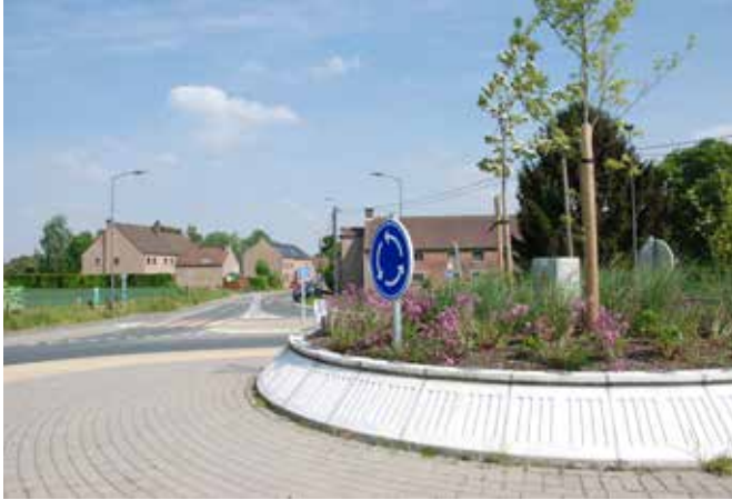
Merci à la pépinière Le Try, qui a adopté le rond-point de Céroux.