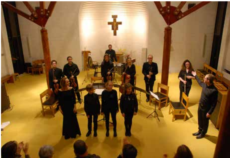
«Sturm und Klang» à Clerlande, en mars dernier.