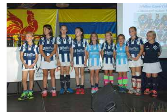
Meilleur espoir collectif L'équipe pré minime fille 1 du LLN Hockey Club