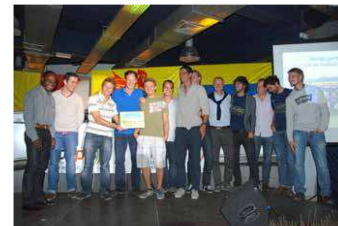
Mérite sportif collectif Le club de football Curtis l'Ausèle