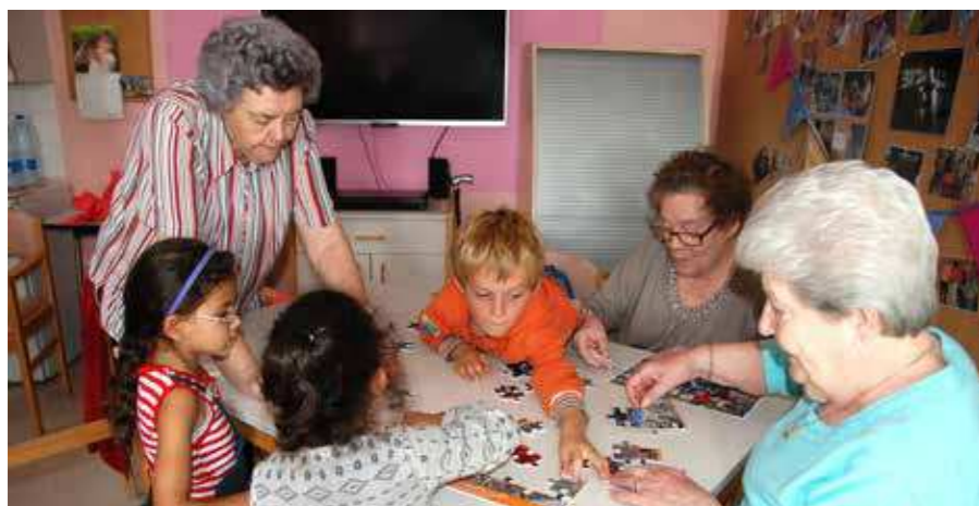
Enfants et seniors réunis autour de puzzles, pour les 20 ans de la Résidence du Moulin.

Les seniors de la Résidence du Moulin ont accueilli dix élèves de l'école de Limauges, le 30 septembre.