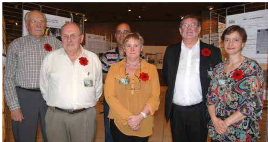
Les membres du Cercle d'histoire.

Le Cercle d'histoire local « Chago » n'a pas voulu être en reste. Il a invité les habitants à se souvenir des événements tragiques de 14-18 à l'occasion d'une exposition « La Grande Guerre à Cérroux-Mousty, Limelette et Ottignies » au Centre culturel d'Ottignies, du 19 au 21 septembre.