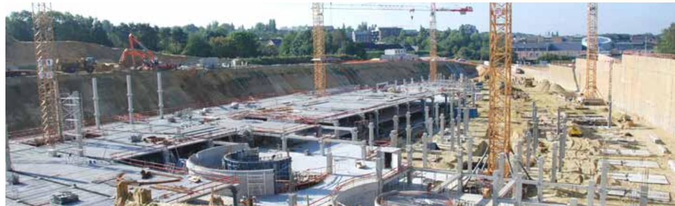
La construction des parkings du RER à Louvain-la-Neuve.

Louvain-la-Neuve poursuit son développement : du côté du lac avec le projet «Agora», à l'Est avec «Les Jardins de Courbevoie»... en songeant déjà à l'urbanisation d'une trentaine d'hectares autour de la ferme de Lauzelle et dans la zone Athéna.